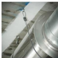
Tout type de béton