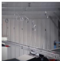
Armatures / Rails Chemins de câbles Panneaux isolants