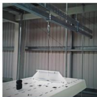
Luminaires, Armatures, Panneaux rayonnants, Conduites d'air