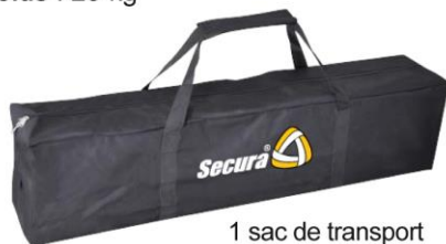
1 sac de transport